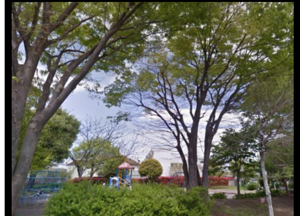
荏田南もも公園まで徒歩1分

●所在地／横浜市都筑区荏田南5丁目 ●土地面積／D区画：165.44㎡(50.04坪) E区画：137.44㎡(41.57坪) ●土地権利／所有権 ●地目／畑 ●都市計画／市街化区域 ●用途地域／第1種低層住居専用地域 ●建 ぺい率／40% ●容積率／80% ●接道／南西側 幅員6.0m公道 北西側 幅員9.0m公道 ●地勢／平坦 ●引渡時期／相談 ●設備／公営水道・公下水・都市ガス ●その他法令／第1種高度地区・地区計画 ●備考／ 要農地転用届・E区画は建築基準法第53条の2第1項第3号の許可(敷地面積の最低限度の許可)に関する 建築審査会包括同意基準に適合した建築許可を取得しなければなりません。・造成後のお引渡しとなります。 本物件は、土地売買契約締結後3ヶ月以内に株式会社ハウゼと建築工事請負契約を締結することを条件に販売 いたします。建築工事請負契約が成立しなかった場合、土地売買契約は白紙となり、受領した金員は全額無利 息にて返還いたします。